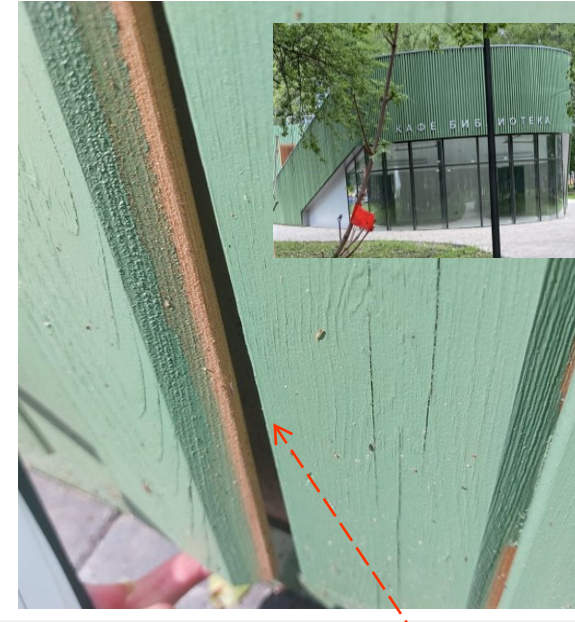
Кафе не функционирует, на фасаде павильона в отдельных местах планкен не примыкал к основанию (имелись щели)