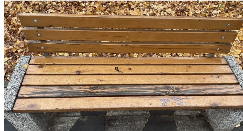
Лаковое покрытие на деревянных поверхностях отдельных скамеек стерлось (не сохранилось)