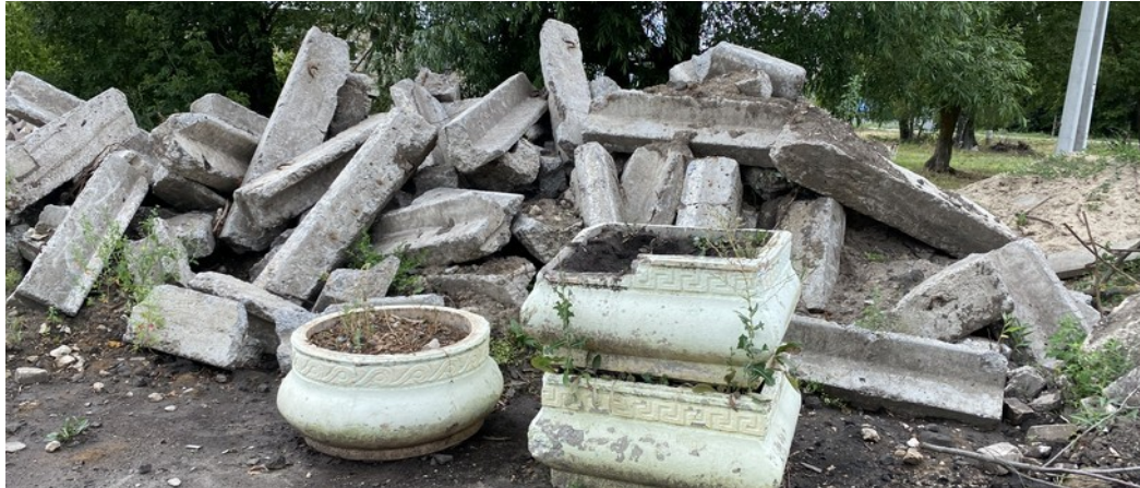
Приняты и оплачены невыполненные работы по транспортировке на полигон строительного мусора и его утилизации